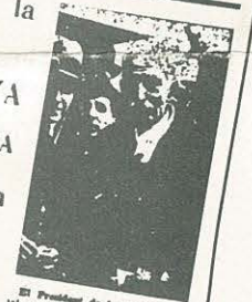
El President de la República Catalana, Sr. Francesc Macià, entre la multitud que l'acclama.

PROCLAMACIO DE L'ESTAT CATALA Macià entrà al Palau de la Generalitat, on implantà la república catalana INSTAURACIO DE LA REPUBLICA ARREU D'ESPANYA EL REI RESIGNA ELS PODERS EN EL SR. ALCALA ZAMORA Els signants del manifest de desembre es constitueixen en Govern provisional de la República Els regidors de l'Esquerra Republicana prenen possessió de l'Ajuntament de Barcelona